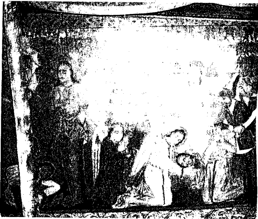
የሰማዕታተ ክብራቸው ስለ ፈጣሪያቸው ምድራዊ መከራን መቀበል ነው

ይለት ሄድሮስ ግደሉ ብሎ ጭፍራ ላከበት ከቤቱ ቢሄዱ አጡት በኋላ መልአኩ ለእናቱ ለኤልሳቤጥ ይህ ዓላጭ ልጅሽን ሊገድለው ነውና ህፃኑን ይዘሽ ወደ ገዳም (በረሃ) ሂጅ ብሏት የሐንሰን ይህ በረሃ ሄዳለች ጭፍሮችዋ ከቤተመቅደስ መጥተው ዘካርያስን ብቻውን ሲያገኙት እሱን ከቤተ መቅደስ ውስጥ ገድለውታል ይህንንም ጌታችን በማቱ ፳፫፥፴፭ ላይ “ ... ከጻድቁ ከአቤል ደም ጀምሮ በቤተ መቅደስና በመሠዊ ያዎች መካከል እስካደላችሁት እስከ በራክዩ ልጅ እስከ ዘካርያስ ደም ድረስ በምድር ላይ የፈሰሰው የጸ ድቅ ደም ሁሉ ይደርስባችኋል” በማለት ተናግሯል ለሰማዕታተ ብሉይ ጽሕፈታቸው አቤል ሲሆን ፍጻሜ አቸው ደግሞ ዘካርያስ ነው ። የሐንሰም በገዳም ሳለ የበረሃ ማር እየበላ የግመል ጠጉር እየለ በሰ በመንፈስና በጥበብ በጸጋም ያደግ ነበር ሠላሳ ዓመት ሲሞላው ጌታችን መንፈቅ ሲቀረው መጥምቁ የሐንሰ መንግሥተ ሰማያት በልጅ ነት ፣ ልጅነት በሃይማኖት ልትሰጥ