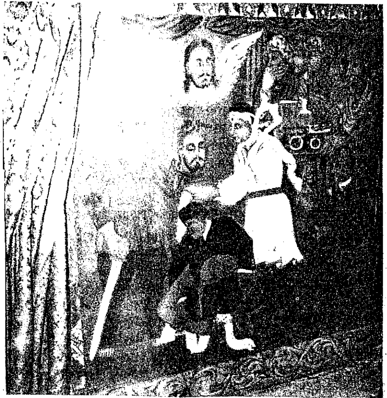
የነብዩ አንገት ተቆጣሪ ለሃድድዳ ሲበረከት

ደረሰና ወንድ ልጅ ወለደች በስም ገተኛው ቀን ሊገርዙት መጡ ስምም ያወጡላት ዘንድ አባቱን ጠየቁት ዘካርያስም ብራና ይህ ስሙን በብ ሬናው ላይ መልአኩ እንደነገረው የሐንሰ ብሎ ጻፈ ወዲያው አንደበቱ ተፈትቶ መንፈስ ቅዱስ ምልቶበት ትንቢት ተናገረ ። በጎረቤቶችም ዘንድ ፍርሐት ሰፊነ ይህ ህጻን ምን ይሆን? አሉ ይህም ማለት እንደ መሴጠላት የሚገድል ባሕር የሚከፍል ደመና የሚጋርድ መና የሚያወርድ እንደ እያሱ በረዶ የሚያዘንም ፀሐይ የሚ ያቆም እንደኤልያስ ሰማይ የሚለ ጉም ዝናብ የሚያቆም እሳት የሚያ ዘንም ይሆን? አሉ ዘካርያስም በመ ንፈስ ቅዱስ ተቃኝቶ አንተ ህጻን የልዑል እግዚአብሔር ነቢይ ትባ ላለህ መንገዱንም ልትጠርግ በጌታ ፊት መንፈቅ ተቀድመህ ታስተምራለህ በማለት ትንቢት ተናገረ (ሚል ፩፥፮ ሉቃ ፩፥፲፮ ሉቃ ፩፥፳፫) ከዚያም በጌታ ልደት ምክን ደት ሄድሮስ ሐፃናትን በሚያስፈጅ በት ሰዓት ዘካርያስ ህጻኑን የሐን ሰን ከቤተመቅደስ አግብቶ ሲጸል