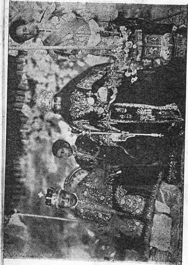
“ ትውልደ ዳድታን ይትባረኩ ” ግርማዊ ኃ ሥ. ክትባረኩ ንጉሣዊ ቤተ ሰገሎ ጋር ።