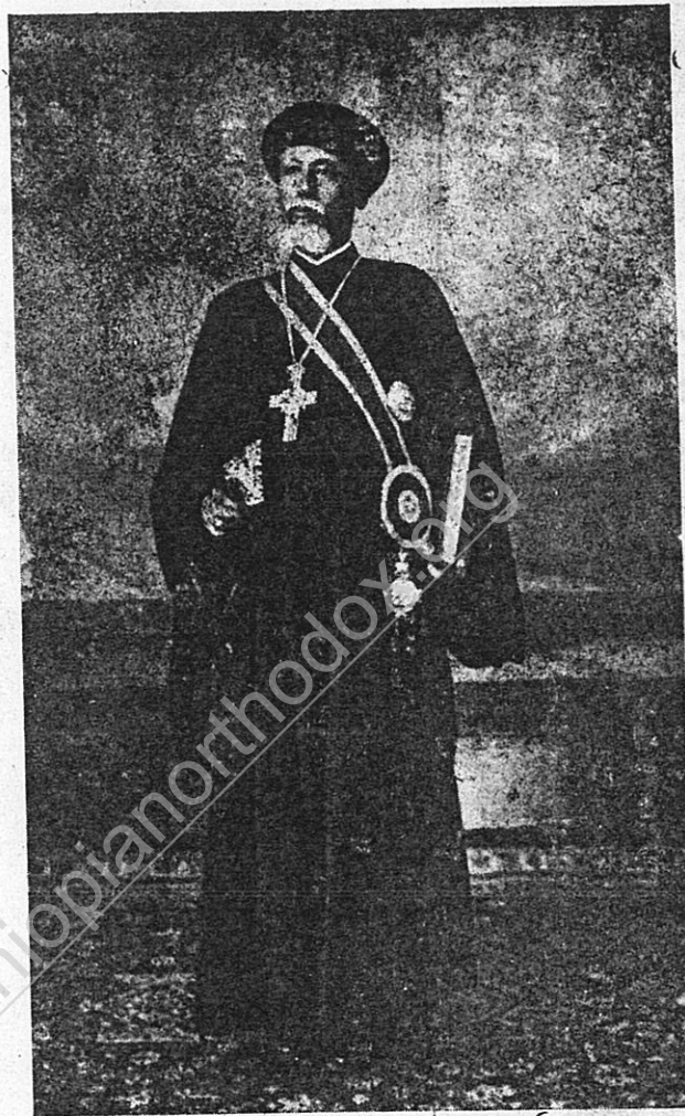
«ՀԻՔԻ ԱԳՊՐ» ՊԱՊԱ ԱՔ ԱՂԳԷ ԽԼԻԳԻՏ