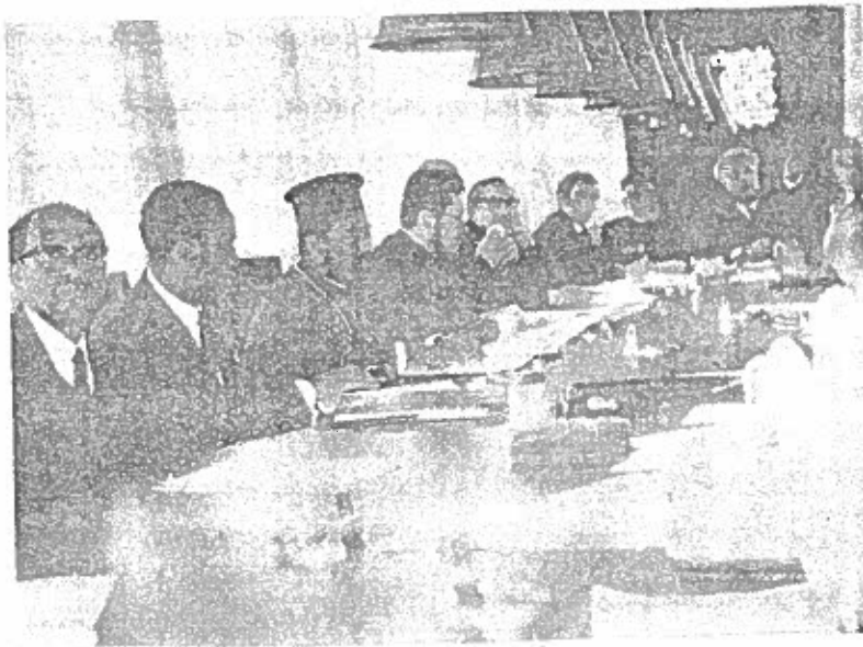
ጆኛው ወይይት ይህን የመሰል ነበር (አዲስ አበባ)

በዚህ ወይይት ከሌሎቹ ወይይቶች ይልቅ በርካት ያሉ አትሞጅያዎችንና ሌሎችም የአርቶዶክስ አብያተ-ክርስቲያናት ወኪሎች ሊቃውንት ተኝተዋል ። ይህም ጉባኤውን ይበልጥ እንደረዳውና ሞገስ እንደሰጠው የውይይቱ ሊቃና መናብርት ከልብ ገልጠዋል ።