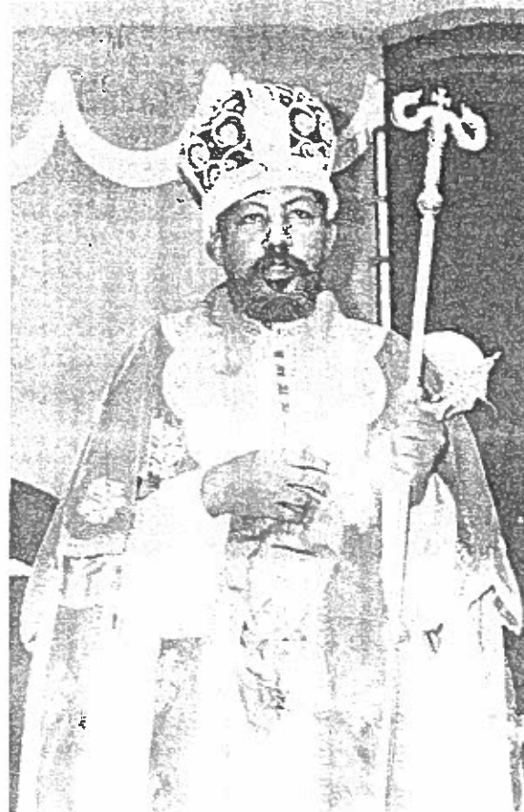
ብዑስ ወትዳስ አቡነ ቴዎድሮስ ርእሰ ሊቃን ጳጳሳት ወፓትረያርክ ዜኢትዮጵያ

ቤተ ክርስቲያናችን ጥንታዊት ስትሆን ዜማዋ ፤ ሥነ ሥርዓቷ ፤ ቋንቋዋ ሌላም ይኸን የመሳሰለው ራሱን የቻለ ሲሆን ፤ ጳጳሱ ብቻ የውጪ አገር ሰው በመሆኑ ቤተ ክርስቲያን ተጥላ ወድቃ እንደኖረች የሚያስገምት ነው ። ጥንታውያን ጳጳሳት ከውጪ አገር ሲመጡ ፤ ዕውቀታቸው በመጠኑ ይሁን እንጂ ፤ ዓለም የት እንደደረሰ ያውቁ ነበር ። የቀረው ቀርቶ የነርሱም ቤተ ክርስቲያን ቢሆን በመጠኑ የተሻለ አስተዳደር ሲኖረው ፤ ለኛ ግን የወሰኑት የጻፉት አንድም ነገር አልተገኘም ። ቤተ ክርስቲያናችን ናት ይኸ ይገባታል ይኸ ያስፈልጋታል ብለው ያቆዩልን አንድም ቋሚ ነገር የለም ። በእርግጥ ቤተ ክርስቲያናችን አልሞተችም ብለን አንዋሽም ። ግን ተባርዶ የማያስፋረው አምላክ ግርማዊ ቀዳማዊ ኃይለ ሥላሴን አሥነሥቶ ቤተ ክርስቲያናችንን ከውድቀት አሥነሣት ። ራሱን የቻለ አስተዳደር እንዲኖራት ኢትዮጵያውያን ጳጳሳት እንዲባርኳት አደረጉ ። ይኸ አንድ ትልቅ ትንሣኤ ሁኖ ስናከብረው ፤ ፍጹም የቤተ ክርስቲያናችን ትንሣኤ ይሆን ዘንድ በፓትረያርክነት ደረጃ እንድትገኝ ያደረጉት በተጨማሪ የቤተ ክርስቲያናችን ፍጹም ትንሣኤን የሚሰብክ ነው ።