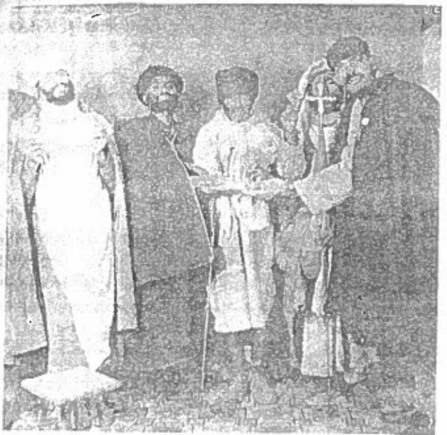
ሰባኪዎችን እነዚህ . . . ናቸው ።

ዛሬም ቢሆን እውነተኛ ሰባኪዎን ከተገኙ ፤ በምእመናን ዘንድ ክፍ ያለ ተወዳጅነት ሊኖራቸው እንደሚችል አያጠራጥርም ። ዛሬ በቤተ ክርስቲያናችን ላይ የወደቀባት ትልቅ ችግር መስሎ የሚታየው ፤ እንደ ሐዋርያት በስብከት ዘዴ የሠለጠኑ ምሁራን በብዛት አለመገኘታቸው ነው ። « ሰማይ ተንዶ ይጫጋህ ፤ መሬት ተከፍቶ ይዋጥህ ፤ ይሰበርህ ፤ ይሰንጥርህ ፤ መጻፍት ያውርድብህ