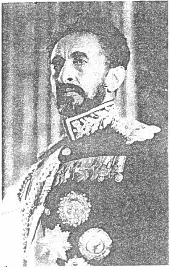
ግርማዊ ቀዳማዊ ኃይለ ሥላሴ ንጉሠ ነገሥት ከኢትዮጵያ (የቤተ ክርስቲያናችን ራስና የክርስትና ሃይማኖት ጠባቂ) ።

በተለይ በዚህ በኛ ዘመን ሥጋዊ ሥልጣኔ ብቻ እያደገ የአገቡን ልዩና እየበዘበዘ ማርኮ በሚወስድበት ጊዜ ፤ በመንፈሳዊ አርበኝነት ታጥቆ በአለሀ በት ጽና የሚል ሃይማኖታዊ አዋጅ የሚናገር እንደ ቅዱስ ገብርኤልም «ንቁም በበሀላዌነ እስከ ንረክዖ ለአምላክነ» በማለት የሽማግሌውንም ፤ የወጣቱንም መንፈስ የሚያጽናና ፤ በመንፈስ ከመድከምና ከመሰበር አድነው ሁሉም መንፈሳዊ ጉዳዮችን እንዲራመድ የሚመሩን ንጉሠ ነገሥት ቀዳማዊ ኃይለ ሥላሴ ያለ ዘመናቸውን ሁሉ ለቤተ ክርስቲያን ሥራ ያዋሉት ሲሆን ፤ አሁን የሥራቸው ሁሉ ጉልላት አድርገው የሰጡን ጌራ መዋዕ ብለን ልንሠይመው የሚገባን ሢመተ ፓትረያርክ ነው ። ይኸ በመጨረሻ ጊዜ ያቀዳጁን ጌራ መዋዕ የኢትዮጵያ ነገሥታት ሁሉ የቤተ ክርስቲያናቸውን መሠረቶች የቤተ ክርስቲያን ጉልላቶች እንደሆኑ የሚያስታውስ ጉልህ ሥዕል ነው ። ግርማዊ ንጉሠ ነገሥት ቀዳማዊ ኃይለ ሥላሴ ይኸን ጌራ መዋዕ የምንለውን ሢመተ ፓትረያርክ ያስገኙት ከአልጋ ወራሽነታቸው ጊዜ ጀምሮ ያለማቋረጥ በአደረገት መንፈሳዊ ትግልና ውጊያ እንደሆነ ስንመለከት ፤ ማንኛውም ሰው ትግሉን ያለማቋረጥ ከእግዚአብሔር እምነት ጋር ከቀጠለ በድል አድራጊነት እንደሚገለጥ የታመነ ማስረጃ