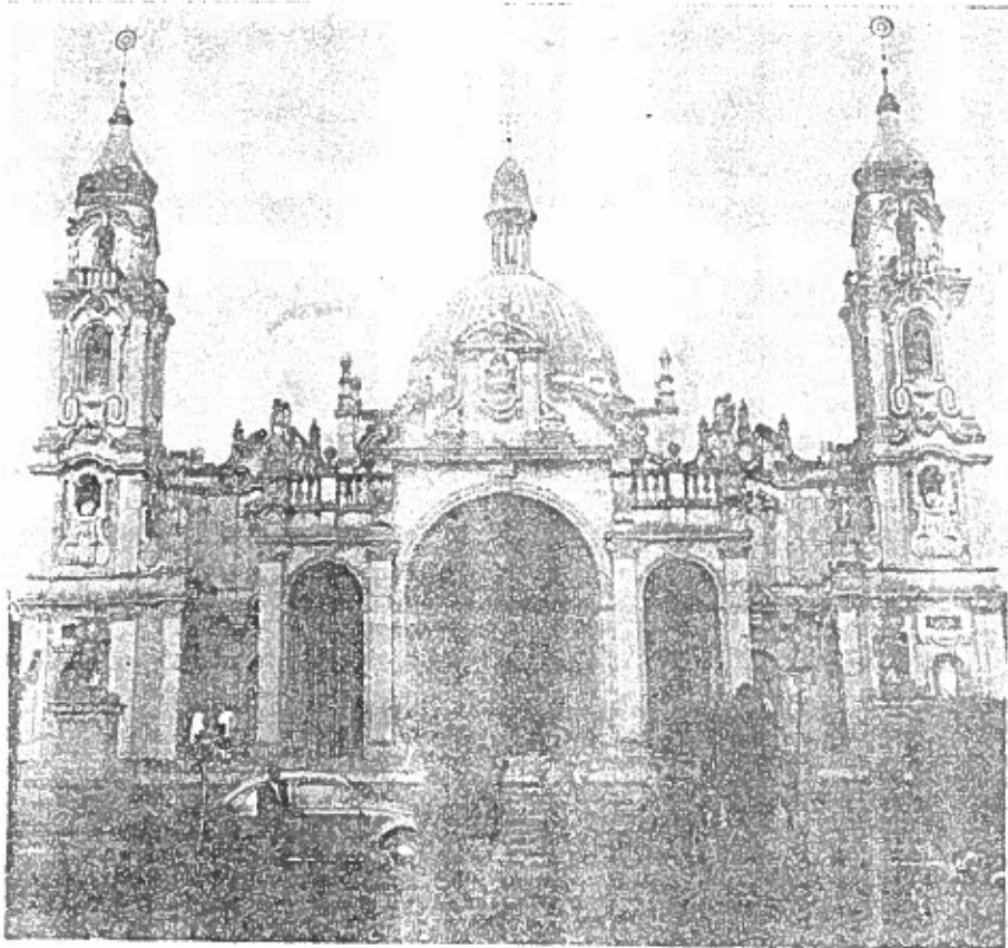
ከአዲስ አበባ አብያተ ክርስቲያናት አንዱ ታላቁ የመንበረ ፀባዖት ቅድስት ሥላሴ ካቴድራል ይህ ነው

ይህ ምድ ራጊዜው የአዲስ አበባን አድባራት ብቻ ይያዝ እንጂ ጠረጠራ በቆይም ተከተል የእያንዳንዱን ጣ ግዛት አብያተ ክርስቲ ዮና ከዚያውም ውስጥ ይብርና ገዳም ፣ ገጠርም በመለየት እንዲ ገናኛለንና ስለታላቱ ቦታ ዝርዝር ውናቱ በመግለጽ እንገልጻለን።