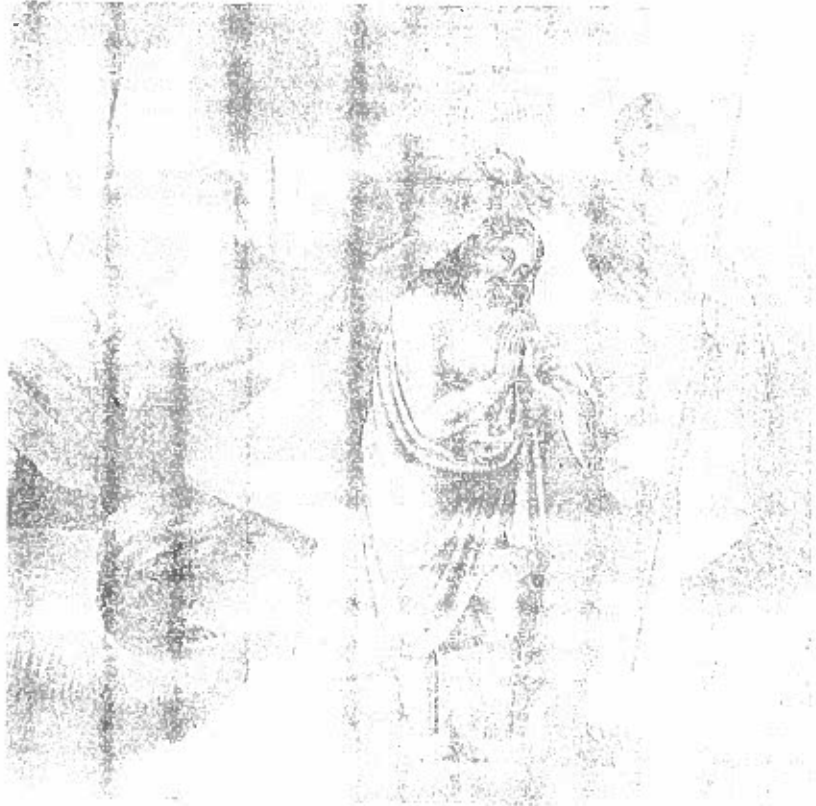
የክርስትና መሠረት የጌታ ጥምቀት ነው ።

ሌላው ዓለምን በዚህ መልክ ያከብረዋል? ሌላውም ዓለም በተለይም ጥንታውያን አብያተ ክርስቲያናት የተባሉት የጥምቀትን በዓል በሚገባ ያከብራሉ ። ነገር ግን እንደ አ.ት.ዮ.ጵ.ያውያን ፪ኛ/ ሰልፍ ተሰልፎ አደባባይ ወጥቶ ሕዝብና ካህናት ተባብሮ አያከብረውም ፤ ፪ኛ/ ታቦቱ ወንዝ ወርዶ ፤ ትልቅ ደግሞ ተደርጎ አይከበርም ፤ ፫ኛ/ በጠቅላላው ይህን የመሰለ ትርጉም ሰጥተው አያከብሩትም ፤ እኛ ግን ፩ኛ/ የክርስትናን እምነት ለማጽናት እንዲሁም የዮርዳኖስን