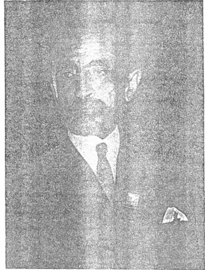
ግርማዊ ቀዳማዊ ኃይለ ሥላሴ ንጉሠ ነገሥት ዘኢትዮጵያ (የክርስትና ሃይማኖት ጠባቂ)