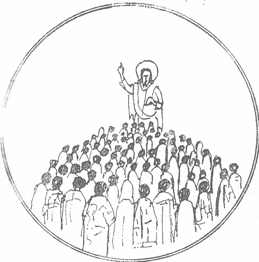
ክርስቶስ በተራራ ሲያስተምር።

በብሉይም ሆነ በሐዲስ ኪዳን ማስተማር ከእግዚአብሔር የታዘዘ መንፈሳዊ ሕግ ሲሆን ተምሮ አለማስተማር ደግሞ ከፍተኛ ያልሆነው ሰው አድርጎ ትግትን ያስከትላል።