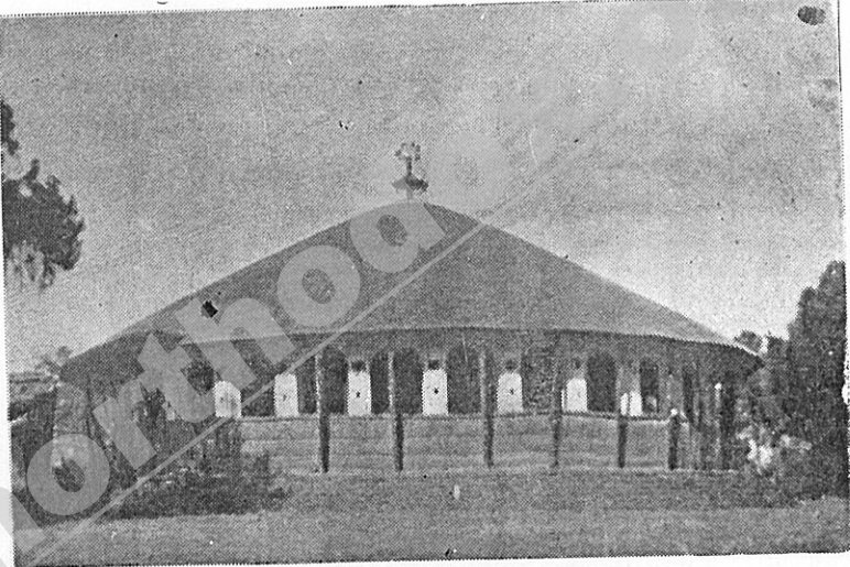
የዲማ ፡ ቅዱስ ፡ ጊዮርጊስ ፡ ቤተ ፡ ክርስቲያን ።

እንዲሁም ፡ በአባትነታቸው ፡ እየጠበቁ ፡ እየረዱ ፡ ላሳደጉኝና ፡ ማንኛውንም ፡ የዕውቀት ፡ ፍሬ ፡ ለማግኘት ፡ በቡራኬያቸውና ፡ በሀብታቸው ፡ በልግስናቸው ፡ ለደገ ፉኝ ፡ ለብፁዕ ፡ ወቅዱስ ፡ ፓትረያርክ ፡ ርእሰ ፡ ሊቃነ ፡ ጳጳሳት ፡ አቡነ ፡ ባስልዮስ ፡ ሐዋ ርያዊት ፡ ርስትን ፡ እንዲያድልልኝ ፡ ፈጣሪዬን ፡ እለምነዋለሁ ።