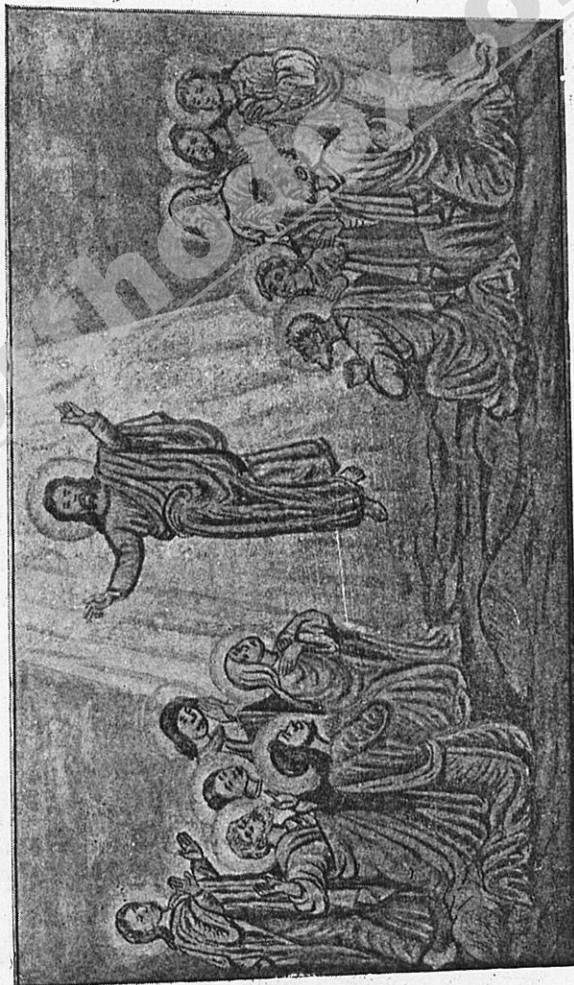
አልቦ ፡ ዘዐርገ ፡ ውስተ ፡ ሰማይ ፡ ዘእንሀላ ፡ ዘወረገ ፡ ደምህማይ ፡ ወልደ ፡ ዕንላ ፡ እመሕያው ፡ ዘውእቲ ፡ ይነብር ፡ በየማነ ፡ እግዚአብሔር ፡ የቀ ፡ ም ፡ ፲፫ ።

ከአብ ፡ ተመሥርታ ፡ ከወልድ ፡ የምታደርሰውን ፡ በመንፈስ ፡ ቅዱስ ፡ የምትፈጸመውን ፡ የተዋሕዶ ፡ ገይማኖት ፡ ፈጣሪያችን ፡ በቸርነቱ ፡ ይግለጥልን ። አሜን ።